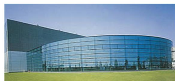
三協立山(株)アルミ工場見学