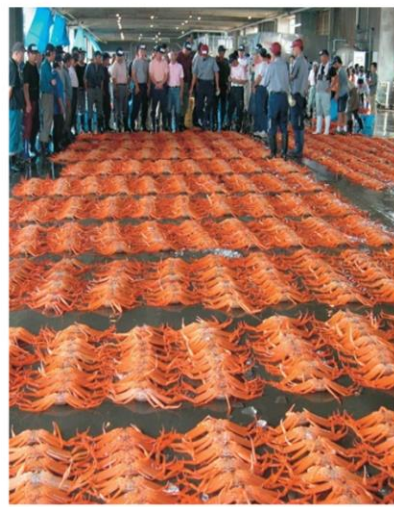
高志の紅ガニ 昼セリ見学