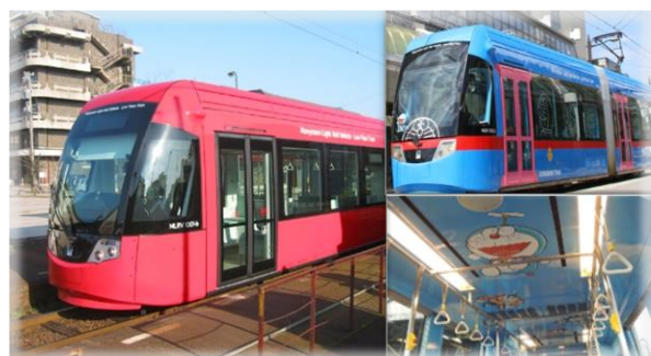
万葉線(ドラえもんトラム)