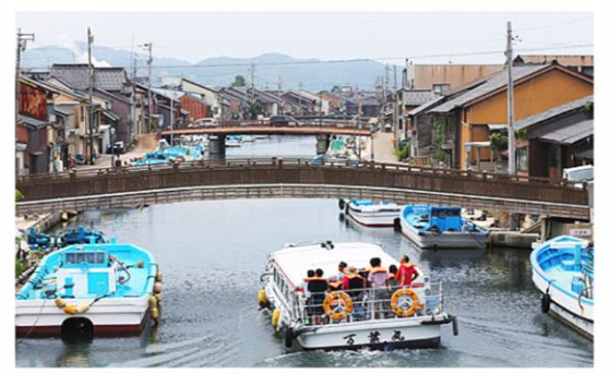
内川12橋巡り観光船