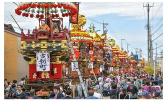
いみずの曳山祭り